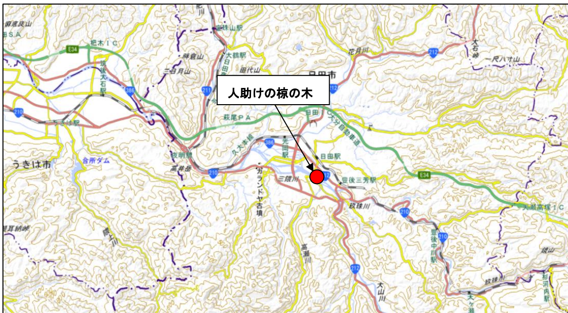
▲人助けの棕の木の位置（大分県日田市若宮町）