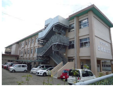
▲宮崎市立赤江小学校の非常階段（宮崎市）