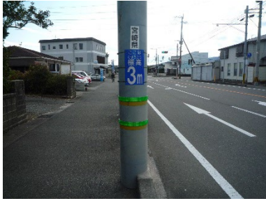
▲標高表示板（宮崎市）