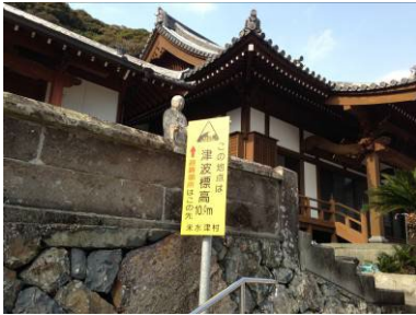
▲津波標高・避難所案内板 (佐伯市米水津)