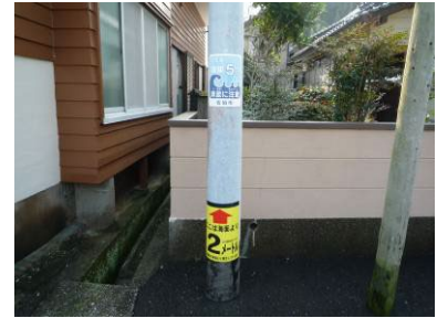
▲海拔表示板 (佐伯市米水津)