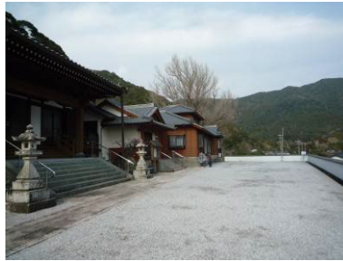
▲津波避難所の指定の養福寺の庭 (佐伯市米水津)