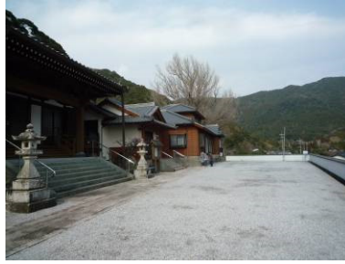
▲津波避難所の指定の養福寺の庭 (佐伯市米水津)