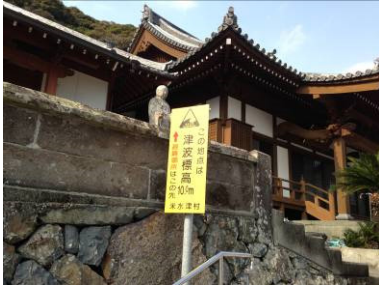
▲津波標高・避難所案内板 (佐伯市米水津)