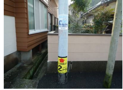
▲海拔表示板 (佐伯市米水津)